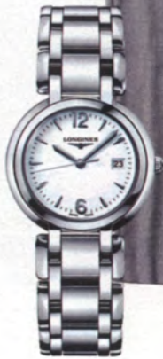
Edelstahl-Uhr von Longines, ca. 730 Euro.