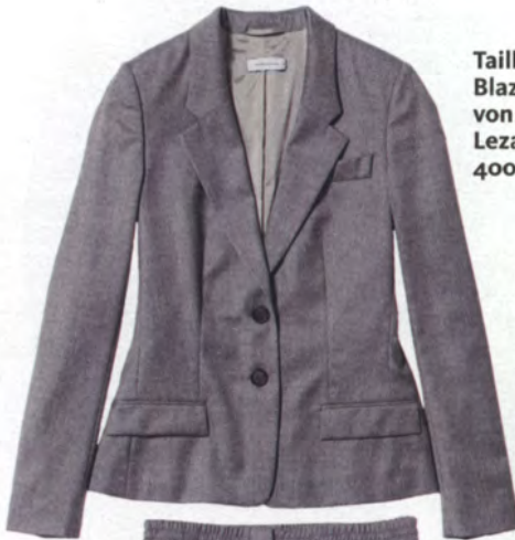
Taillierter Blazer von René Lezard, ca. 400 Euro.

Grandiose, anpassungsfähige Farbe. Überzeugt im Job ganz clean und eher maskulin mit Business-Anzug, wenig (aber plakativem) Schmuck, raffinierten High Heels. Und feiert am Wochenende im Rockabilly-Look: Grobstrick, Röhrenjeans in 7/8-Länge, spitze Pumps. Das Best-of dabei: der coole Mantel!