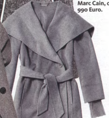
Doubleface-Mantel von Marc Cain, ca. 990 Euro.