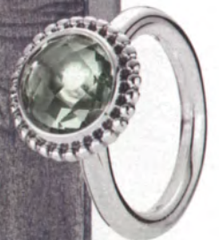
Ring aus Sterling-silber mit grünem Amethyst, von Pandora, ca. 85 Euro.