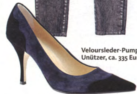
Veloursleder-Pumps von Unützer, ca. 335 Euro.