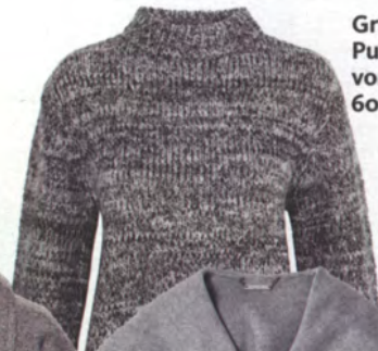
Grobstrick-Pullover von Cos, ca. 60 Euro.