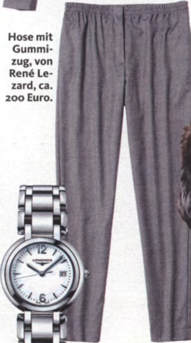
Hose mit Gummizug, von René Lezard, ca. 200 Euro.