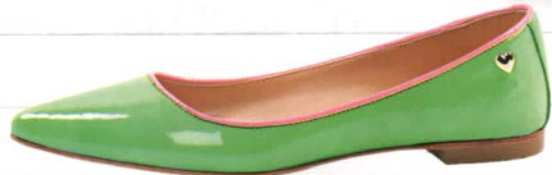
↑ TWIN-SET Grünes Lackleder, rosafarbene Paspelierung, Herzapplikation, ca. 199 €