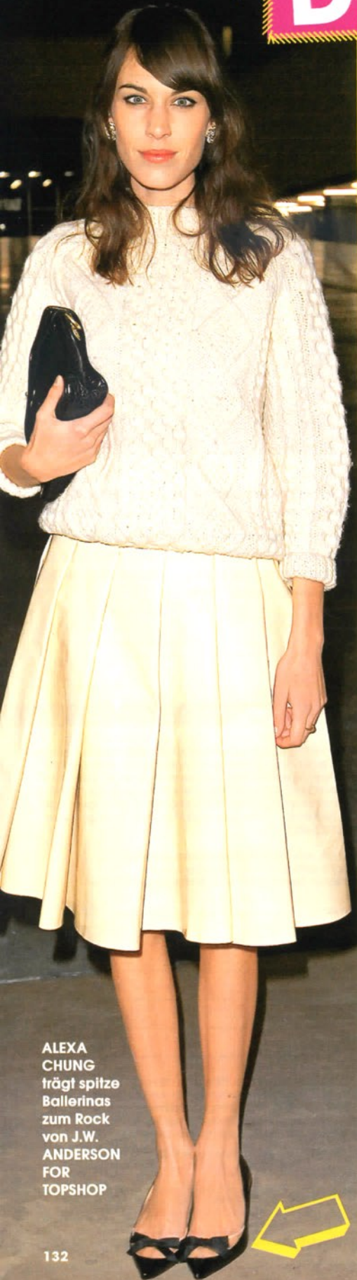
ALEXA CHUNG trägt spitze Ballerinas zum Rock von J.W. ANDERSON FOR TOPSHOP

Totale Revolution! Plötzlich lieben alle FLACHE SCHUHE : Spitze Ballerinas, Loafer, Kittenheels. Warum eigentlich?