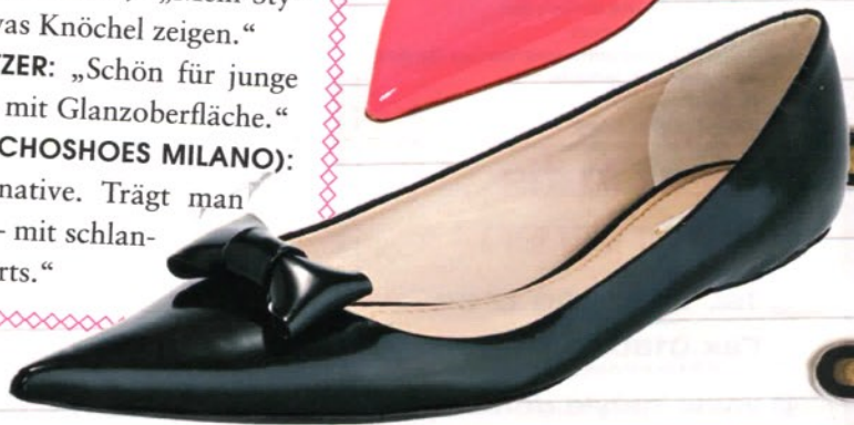
→ MARC JACOBS Schwarzes Lackleder, Schleife, ca. 453 €