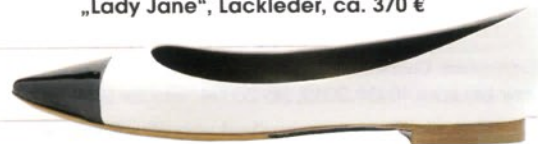
↑ UNÜTZER Weißes Glattleder, schwarze Zehenkappe, ca. 305 €