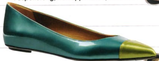
↑ SERGIO ROSSI Two-Tone-Ballerinas, Modell „Lady Jane“, Lackleder, ca. 370 €