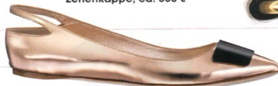
↑ DIOR Leder in Rosémetall, Fersenriemchen, schwarze Spongel, ca. 530 €