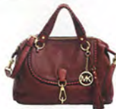
Michael Kors über monnierfreres.de