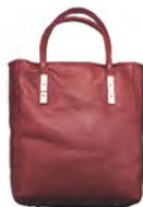
Stine Goya für Adax