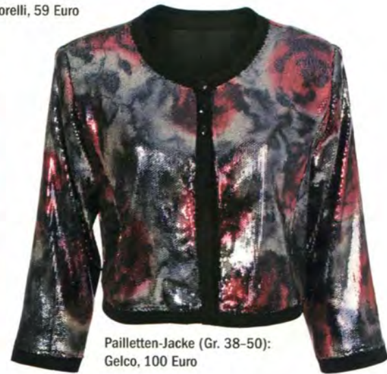
Pailletten-Jacke (Gr. 38-50): Gelco, 100 Euro