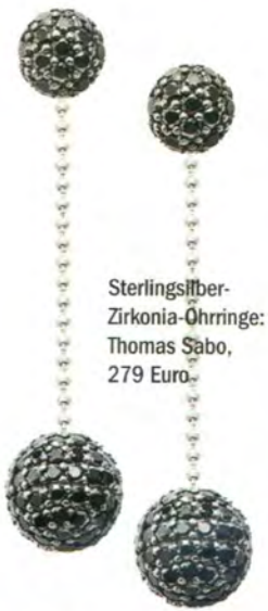
Sterlingsilber-Zirkonia-Öhringe: Thomas Sabo, 279 Euro