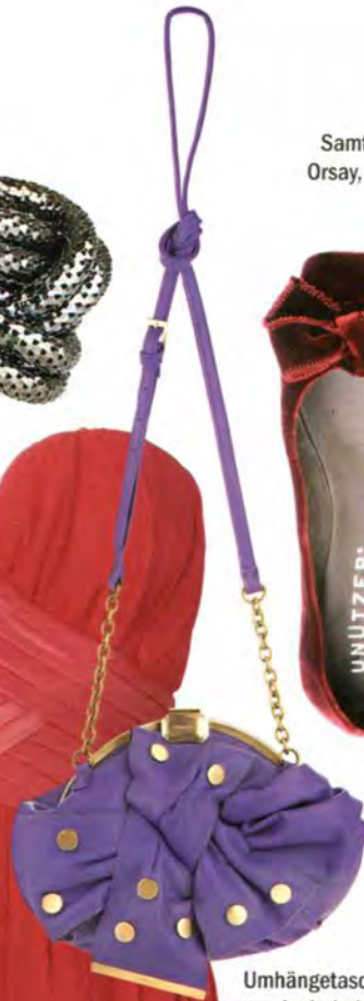
Umhängetasche aus Lederimitat: Fiorelli, 59 Euro