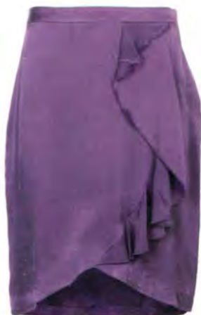
Rock (Gr. S-XL): Edith & Ella, 116 Euro