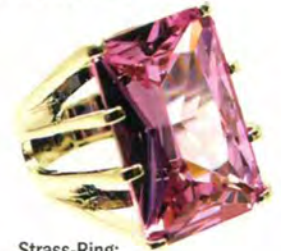
Strass-Ring: Lemper, 58 Euro