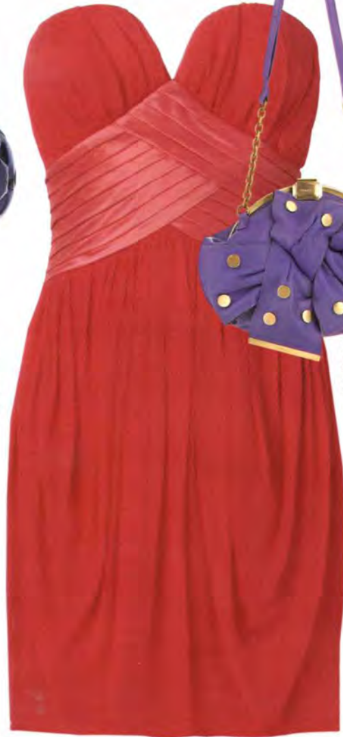
Rotes Kleid (Gr. 34-40): Lipsy, 135 Euro