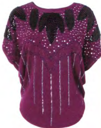
Pailletten-Top (Gr. 34-40): Lipsy, 105 Euro