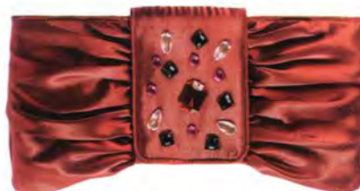
Rote Satin-Clutch: Fabiani by Galeria Kaufhof, 20 Euro