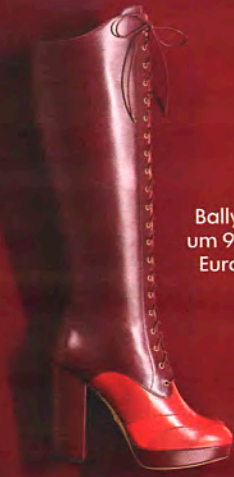
Bally, um 995 Euro