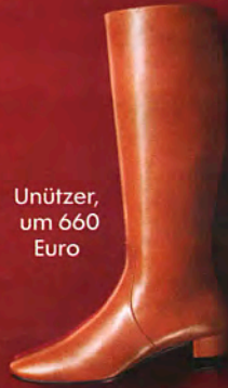
Unützer, um 660 Euro