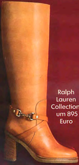
Ralph Lauren Collection, um 895 Euro