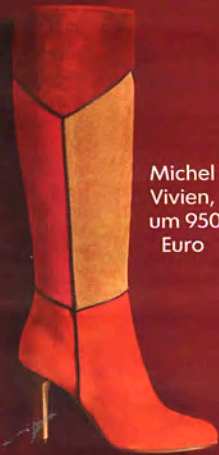
Michel Vivien, um 950 Euro