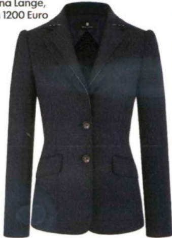
Rena Lange, um 1200 Euro