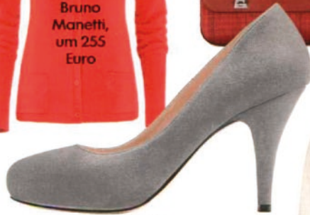
Geox, um 130 Euro