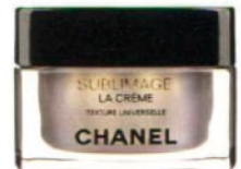
Gesichtscreme "Sublimage" von Chanel, um 275 Euro