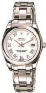
Rolex, um 23070 Euro