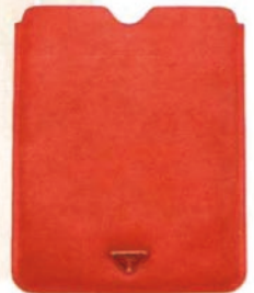
Prada, um 150 Euro