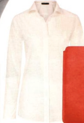
Marc Cain, um 200 Euro