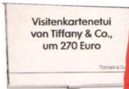
Visitenkartenetui von Tiffany & Co., um 270 Euro