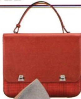
Akris, um 1130 Euro