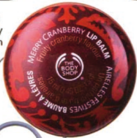
Lipbalm von Body Shop, um 5 Euro