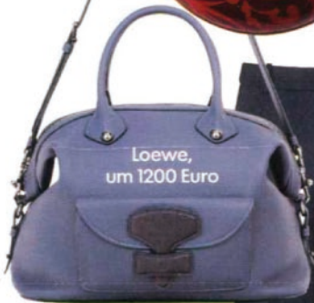
Loewe, um 1200 Euro