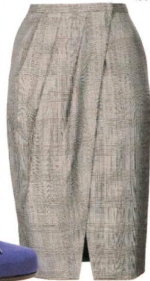
Salvatore Ferragamo, um 520 Euro

Beim Geschäftstermin mit dem Chef oder Kunden unterstreichen Sie Ihre Professionalität mit einem klassisch-zurückhaltenden Look. Zur Grundausrüstung gehört eine schlichte Bluse und ein perfekt sitzender Hosenanzug – am schönsten in Navy. Adäquate Variante: ein weich fallender Pencilskirt mit einem farbigen Cashmrecardigan. Hochwertige Businessaccessoires – vom Füller bis zum Notizbuch – sind subtile Stilbotschafter und suggerieren Perfektion auf allen Ebenen. Beauty: Weniger ist mehr – für einen gepflegten Look genügen Lipbalm und Mascara.