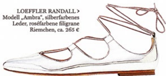
LOEFFLER RANDALL > Modell „Ambra“, silberfarbenedes Leder, roséfarbene filigrane Riemchen, ca. 265 €