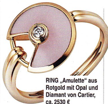
RING „Amulette“ aus Rotgold mit Opal und Diamant von Cartier, ca. 2530 €