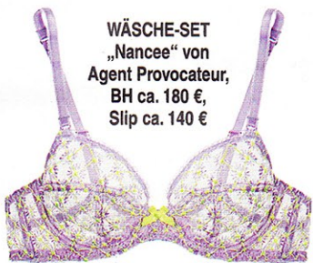
WÄSCHE-SET „Nancee“ von Agent Provocateur, BH ca. 180 €, Slip ca. 140 €