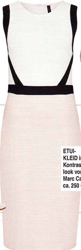
ETUI- KLEID im Kontrast- look von Marc Cain, ca. 250 €