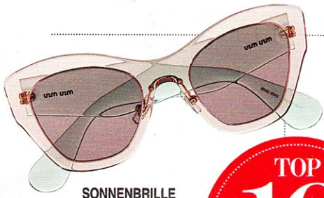
SONNENBRILLE im Two-Tone-Look von Miu Miu, ca. 215 €

TOP 10 Jetzt shoppen auf www.bunte.de/top10