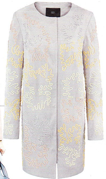
MANTEL in Kastenform mit Fadenstickerei von Steffen Schraut, ca. 499 €