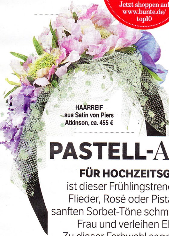
HAARREIF aus Satin von Piers Atkinson, ca. 455 €