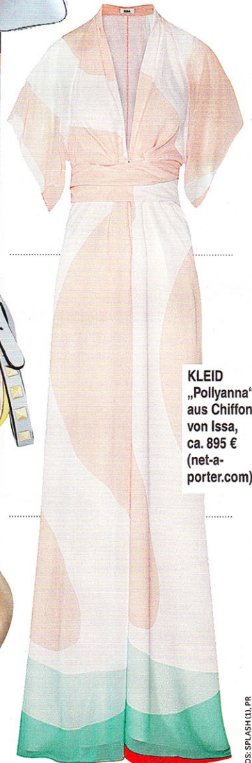
KLEID „Pollyanna“ aus Chiffon von Issa, ca. 895 € (net-a- porter.com)