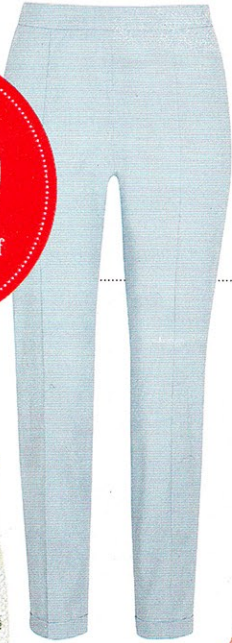
HOSE aus Stretchmaterial von Luisa Cerano, ca. 150 €

TOP 10 Jetzt shoppen auf www.bunte.de/top10