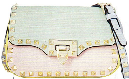
HANDTASCHE „Rockstud“ im Two-Tone-Look von Valentino, ca. 1080 €