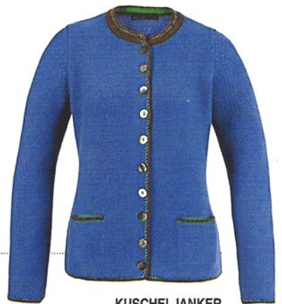
KUSCHELJANKER aus feinstem Kaschmir mit Häkelborte von pierre- clair, ca. 500 €