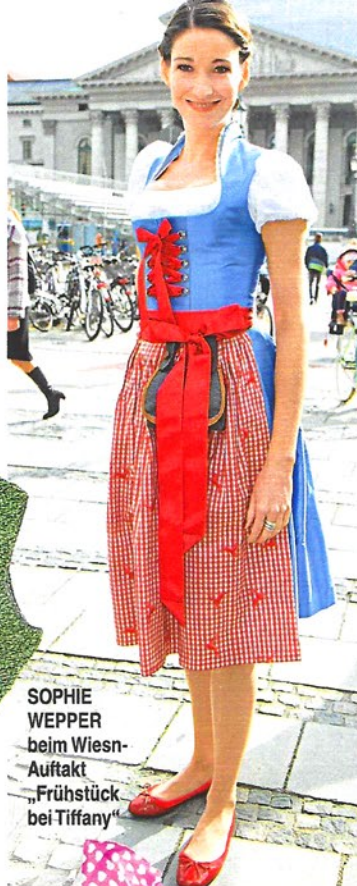
SOPHIE WEPPER beim Wiesn- Auftakt „Frühstück bei Tiffany“