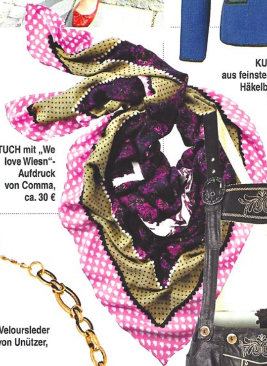
TUCH mit „We love Wiesn“- Aufdruck von Comma, ca. 30 €

BIER & HENDL auf dem Oktoberfest schmecken noch besser in zünftiger Kleidung. Hier die neuesten Kreationen aus der weiten Welt der Wiesn