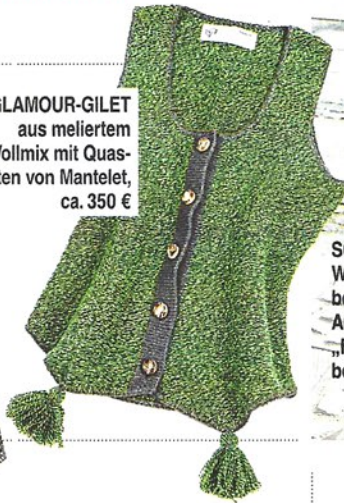
GLAMOUR-GILET aus meliertem Wollmix mit Quas- ten von Mantelet, ca. 350 €