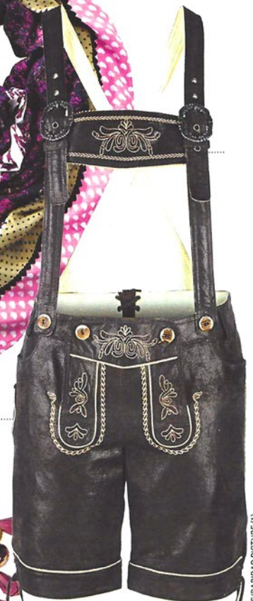
LEDERHOSE mit Latz und traditioneller Stickerei von Adler, ca. 140 €