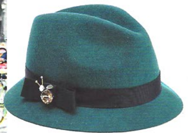
FILZHUT aus Wolle mit Strassbrosche von Marc Cain, ca. 70 €