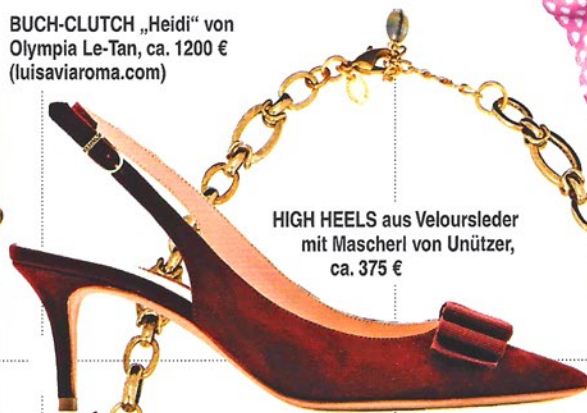
HIGH HEELS aus Veloursleder mit Mascherl von Unützer, ca. 375 €