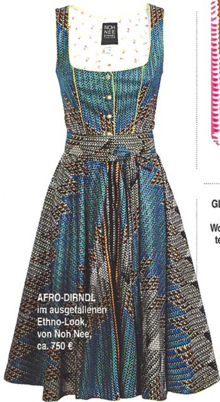
AFRO-DIRNDL im ausgefallenen Ethno-Look von Noh Nee, ca. 750 €