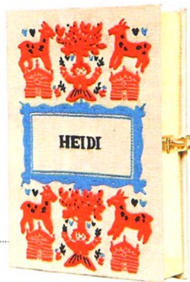
BUCH-CLUTCH „Heidi“ von Olympia Le-Tan, ca. 1200 € (luisaviaroma.com)