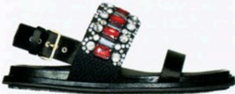
Auf Glitzer-Sohlen: Sandale „Fussbett“ von Marni