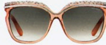
Augenstern: Sonnenbrille von Jimmy Choo