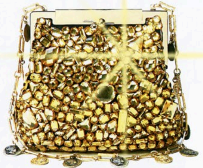
Funkelnder Hingucker: Tasche von Dolce & Gabbana