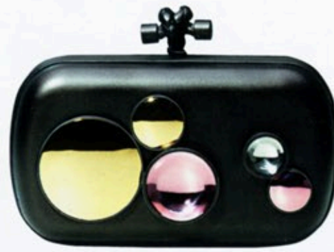
Zum Sich-drin-Spiegeln schön: Pochette „Knot Multisphere“ von Bottega Veneta

Dicke Klunker tragen nur Carmen Geiss und Hip-Hop Stars mit tief hängenden Hosen? Von wegen! Sie sind mehr denn je salonfähig und kommen in dieser Saison auch modisch ganz elegant daher. Wir zeigen die schönsten Funkelstücke