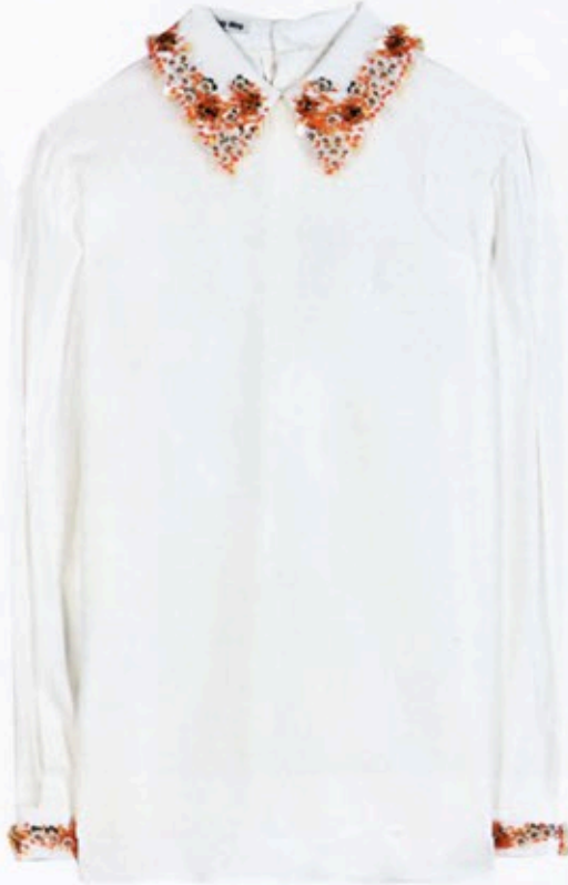
Glitzerkragen: Bluse von Miu Miu über mytheresa.com