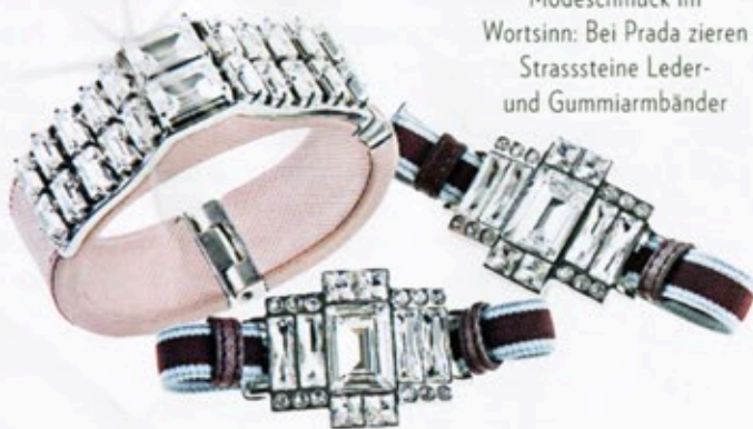
Modeschmuck im Wortsinn: Bei Prada zieren Strasssteine Leder- und Gummiarmbänder