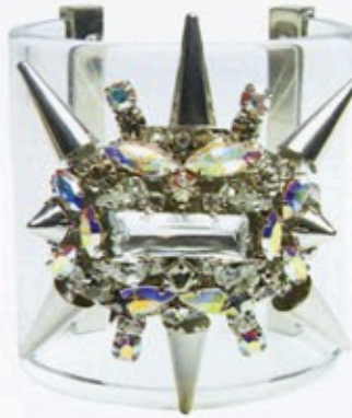
Philipp Plein ist der „King of Bling“. Dieser Armreif ist aus seiner aktuellen Kollektion