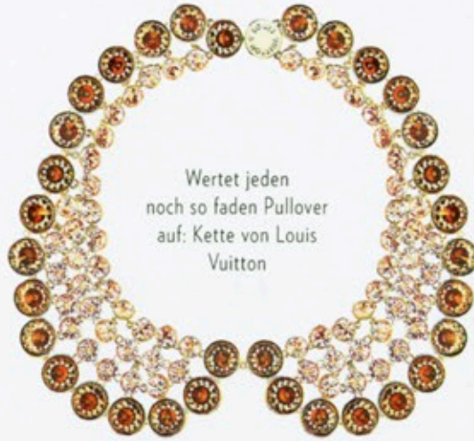
Wertet jeden noch so faden Pullover auf: Kette von Louis Vuitton