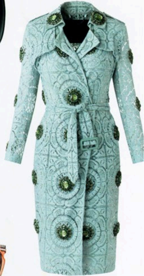
„Couture-Trenchcoat“ von Burberry Prorsum