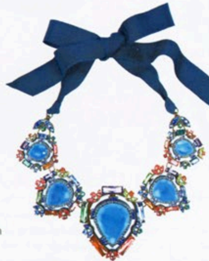
Farb-Kristalle am Ripsband: Kette von Lanvin