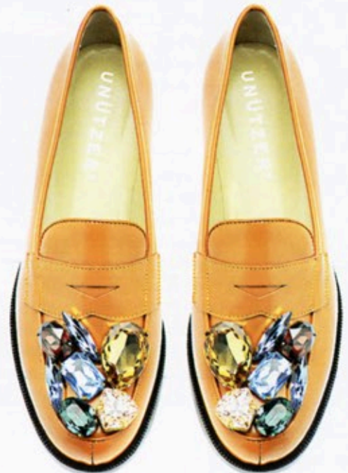
Bling on the Run: Loafer von Unützer für Achtland