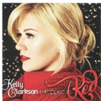
"Wrapped In Red", Kelly Clarkson, Sony, um 16 Euro