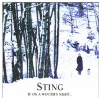
"If On A Winter's Night", Sting, Universal Music, um 15 Euro