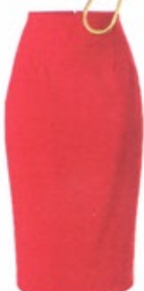
Talbot Runhof, um 400 Euro