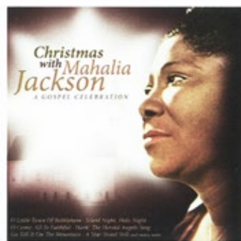
"Christmas With Mahalia Jackson", Sony, um 6 Euro

Der festlichste Moment des Abends? Wenn die ersten Töne von Mahalia Jacksons "Silent Night, Holy Night" erklingen oder Elvis Presleys Bariton "Amazing Grace" anstimmt. Ihr Outfit? Schlicht, aber wunderschön, passend zur emotionalen Musik: Cashmerepullover, schmale Hose und Ballerinas.