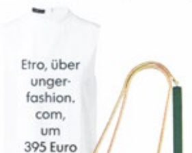
Etro, über unger-fashion.com, um 395 Euro

Bei Ihnen dreht sich am 24. Dezember alles um Gemütlichkeit: mit flachen Schuhen und schlichtem Seidenshirt vor dem Kamin sitzen, in Kindheitserinnerungen schwelgen und sich über Anekdoten des letzten Jahres amüsieren. Perfekte Ergänzung: relaxter Pop von Kelly Clarkson, Michael Bublé, Sting.