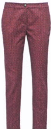
Tommy Hilfiger, um 120 Euro