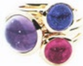
Tamara Comolli, ab 1990 Euro