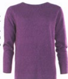
Allude, über luxodo.com, um 310 Euro