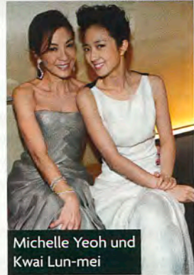
Michelle Yeoh und Kwai Lun-mei

Andere Länder, andere Dimensionen: 200 Models präsentierten in der coolen Location „New Tank“ im Pekinger Galerienviertel die Kollektionen Giorgio Armani, Emporio Armani und Armani Privé vor rund 1000 Gästen. Auf der Aftershow-Party wurde ausschließlich mit Champagner angestoßen.