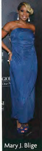
Mary J. Blige