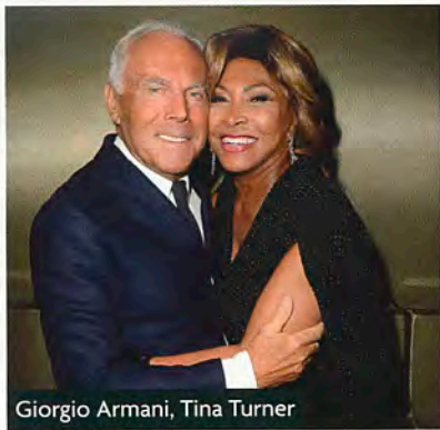
Giorgio Armani, Tina Turner