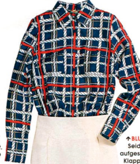
↑ BLU Seid- aufges- Klapp- tasch- Von DA, ca. 58