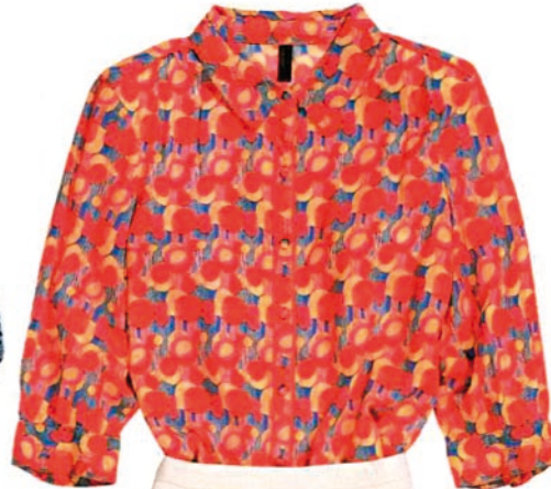
↑ BLUSE Retro-Print. Von VERO MODA, ca. 30 €