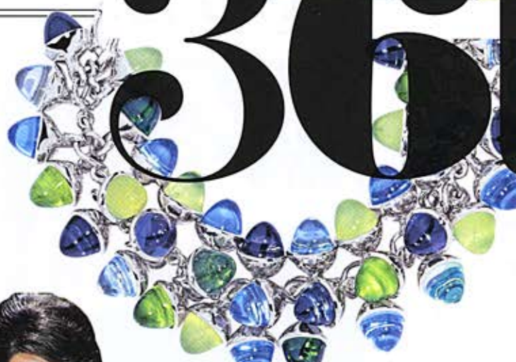
Armband aus Weißgold mit Topasen, Prehniten, Peridoten und Turmalinen, TAMARA COMOLLI, Preis auf Anfrage