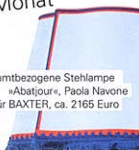
Samtbezogene Stehlampe »Abatjour«, Paola Navone für BAXTER, ca. 2165 Euro