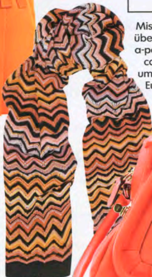
Missoni, über net-a-porter.com, um 360 Euro