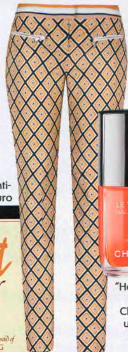
Fay, um 680 Euro