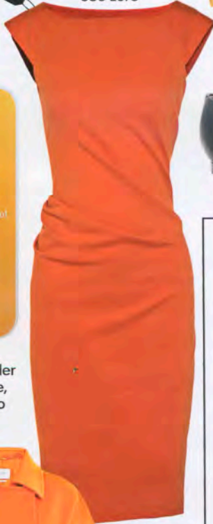
Diane von Furstenberg, über net-a-porter.com, um 360 Euro