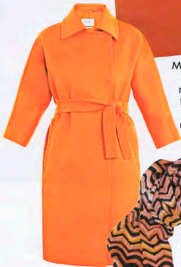
Max Mara, über matches-fashion.com, um 1440 Euro