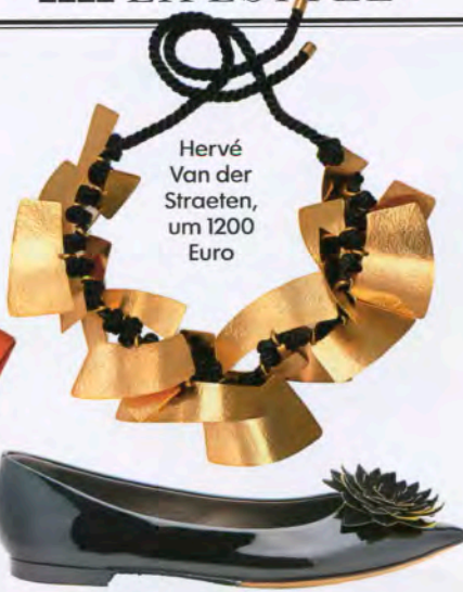
Hervé Van der Straeten, um 1200 Euro