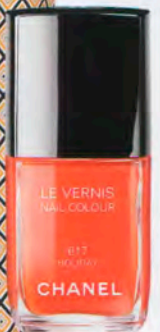
"Holiday" von Chanel, um 24 Euro