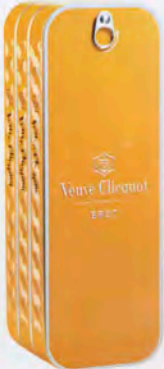
Veuve Clicquot in der Ponsardine, um 45 Euro