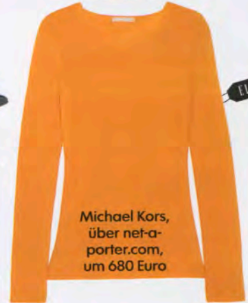
Michael Kors, über net-a-porter.com, um 680 Euro