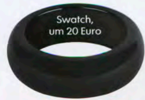
Swatch, um 20 Euro