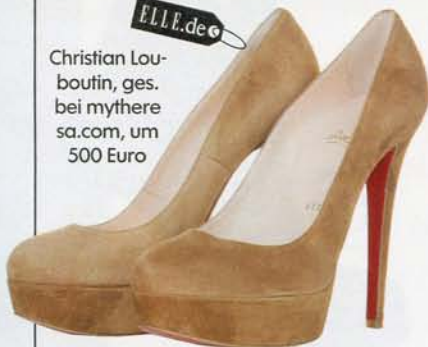
Christian Louboutin, ges. bei mytheresa.com, um 500 Euro

Bauch und Po sind Problemzonen, von denen Sie mit Drapierungen und Signalfarben ablenken können. Shiftkleider konzentrieren die Aufmerksamkeit auf trainierte Arme, da fallen ein paar Kilos zu viel in der Körpermitte nicht ins Gewicht. O-förmige Oberteile lässig mit Gürtel auf Taille bringen. Tricksen können Sie auch mit Accessoires: Plateaus zaubern schmalere Fesseln. Kette und Clutch in XL-Größe stehen Frauen mit fülligen Figuren perfekt.