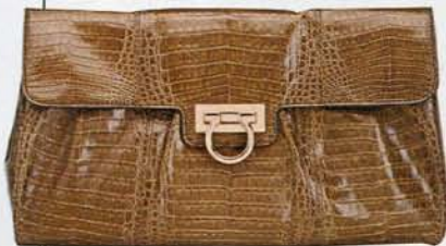
Kroko-clutch von Salvatore Ferragamo, um 5040 Euro