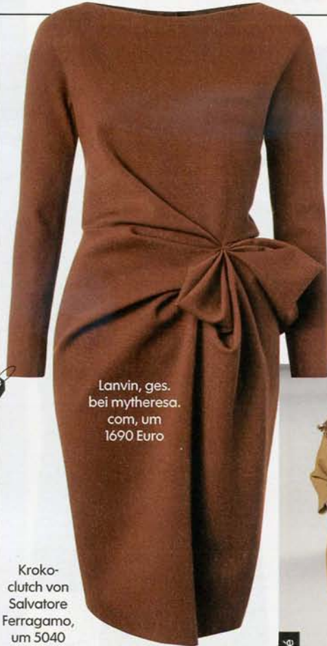
Lanvin, ges. bei mytheresa.com, um 1690 Euro

Üppige Formen, sexy Inszenierung: wie Sie die Stärken Ihrer Figur mit den richtigen Outfits betonen und Ungeliebtes raffiniert kaschieren. Geniale Stylingtipps für Frauen mit Format – von 60 bis 90 Kilo