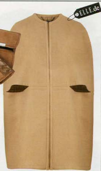
Stella McCartney, ges. bei mytheresa.com, um 850 Euro