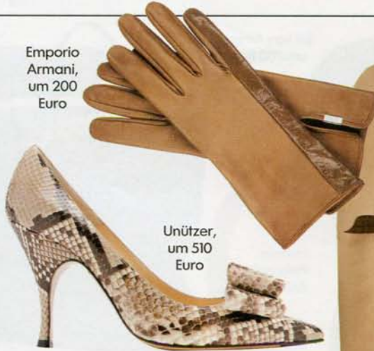
Emporio Armani, um 200 Euro