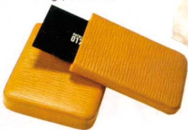
Visitenkartenbox von Bethge, um 85 Euro