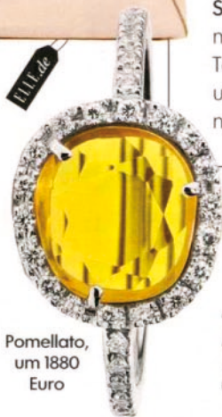
Pomellato, um 1880 Euro