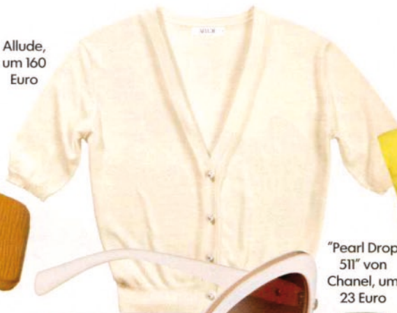
Allude, um 160 Euro