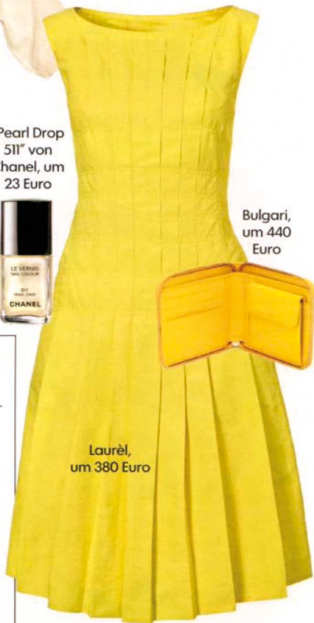
Bulgari, um 440 Euro