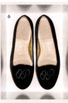
1. Mit Metallkappe und Kette, von Christian Louboutin, um 800 Euro. 2. In Weiß, von Weekday, um 80 Euro. 3. Mit grauem Lackleder, von Gianvito Rossi, um 495 Euro. 4. Aus Canvas in zwei Farben, von Flip-Flop, um 90 Euro. 5. Aus Ziegenveloursleder, von Unützer, um 315 Euro. 6. Aus Samt, von French Sole, um 190 Euro. 7. Mit Troddel und Lochmuster, von Fratelli Rossetti, um 310 Euro. 8. Im Zebra-Print, von Deichmann, um 25 Euro