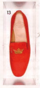
9. Aus Pythonleder, von Alexander McQueen, um 695 Euro. 10. Im Bikolor-Look, von Tod's, um 315 Euro. 11. In glitzernder Netzoptik, von Jimmy Choo, um 295 Euro. 12. Aus Lackleder, von Pretty Ballerinas, um 170 Euro. 13. Mit Krone, von Church's, Preis auf Anfrage