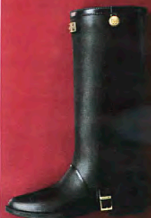
Hunter, um 220 Euro