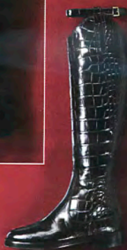
Gucci, um 13 900 Euro