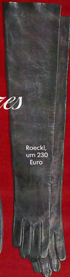
Roeckl, um 230 Euro