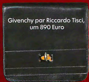
Givenchy par Riccardo Tisci, um 890 Euro