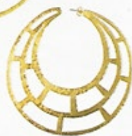
Hervé van der Straeten, ca. 360 €