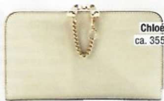
Chloé, ca. 355 €

ACHTUNG: Bunte Kleckse funktionieren nur in Kombination mit Weiß!