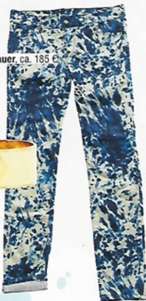
Blauer, ca. 185 €