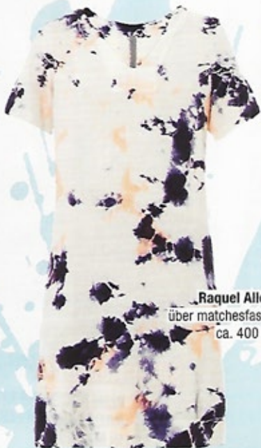
Raquel Allegra über matchesfashion.com, ca. 400 €