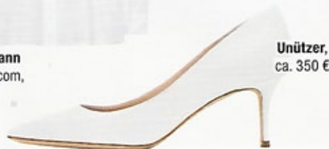
Unützer, ca. 350 €

ACHTUNG: Bunte Kleckse funktionieren nur in Kombination mit Weiß!