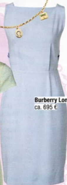
Burberry London , ca. 695 €