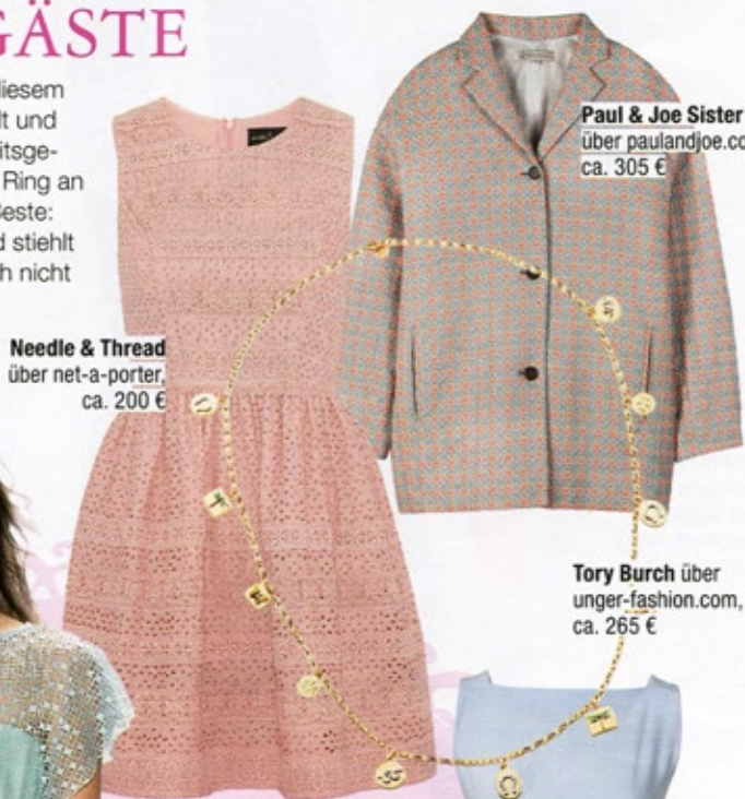
Needle & Thread über net-a-porter, ca. 200 €