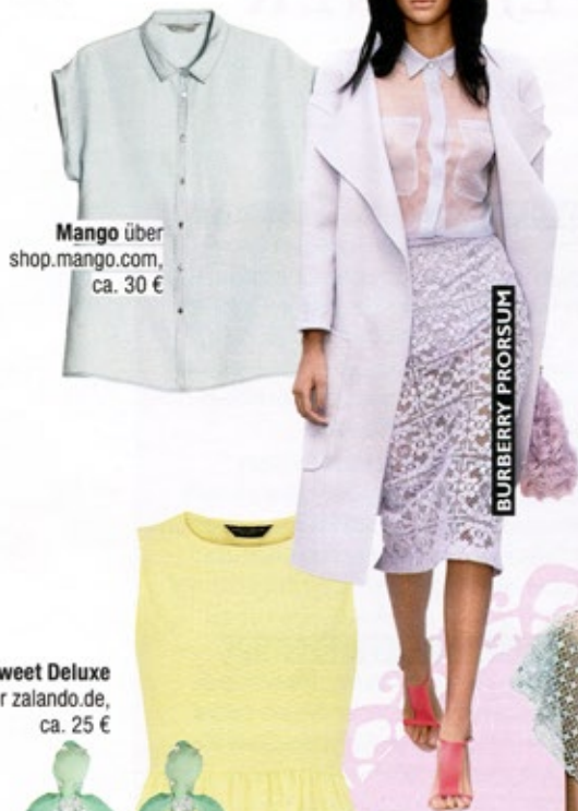
Mango über shop.mango.com, ca. 30 €

Pastell regiert in diesem Jahr die Modewelt und passt zur Hochzeitsgesellschaft wie der Ring an den Finger. Das Beste: sieht chic aus und stiehlt der Braut dennoch nicht die Schau!