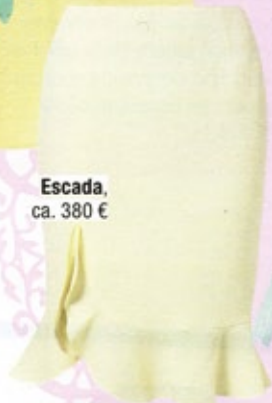
Escada , ca. 380 €