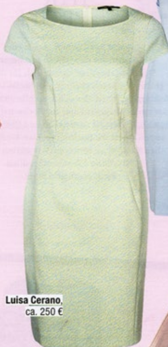
Luisa Cerano , ca. 250 €