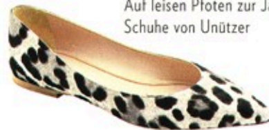
Auf leisen Pfoten zur Jagd: Schuhe von Unützer