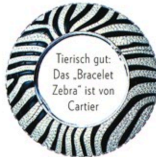
Tierisch gut: Das „Bracelet Zebra“ ist von Cartier