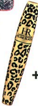
Katzenaugen: Mascara „Lash Queen Feline Blacks“ von Helena Rubinstein