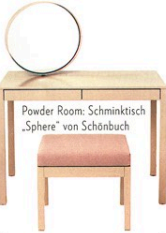
Powder Room: Schminktisch „Sphere“ von Schönbuch