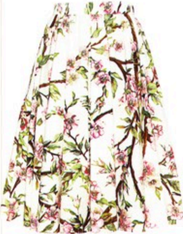
Icona blüht auf: Rock von Dolce & Gabbana über mytheresa.com