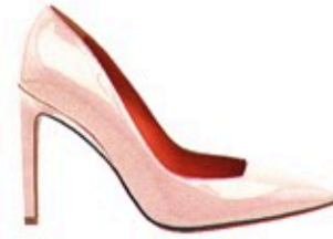
Zuckerguss für die Füße: Lackpumps von Santoni