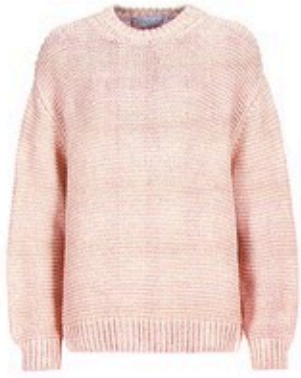
Pretty in Pink: Pullover von Stella McCartney über reyerlooks.com

Sweet like Candy: Ohrhänger von Bucherer