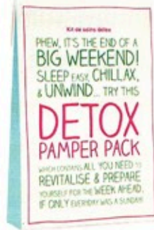
Für den rosigen Teint: „Detox Pamper Pack“ über pinjafashion.de