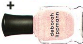
Lucky me! „La vie en rose“ von Deborah Lippmann