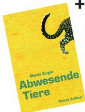
„Abwesende Tiere“ von Martin Kluger (Dumont)