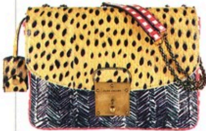
Frisch erlegt: Die Tasche von Marc Jacobs hat Icomi auf net-a-porter.com geschossen