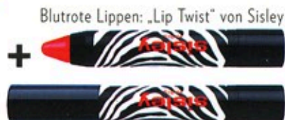
Blutrote Lippen: „Lip Twist“ von Sisley