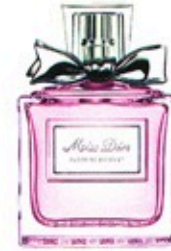
Flower-Power: „Miss Dior Blooming Bouquet“