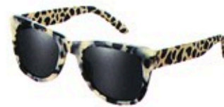
Alles im Blick: Sonnenbrille von Burberry